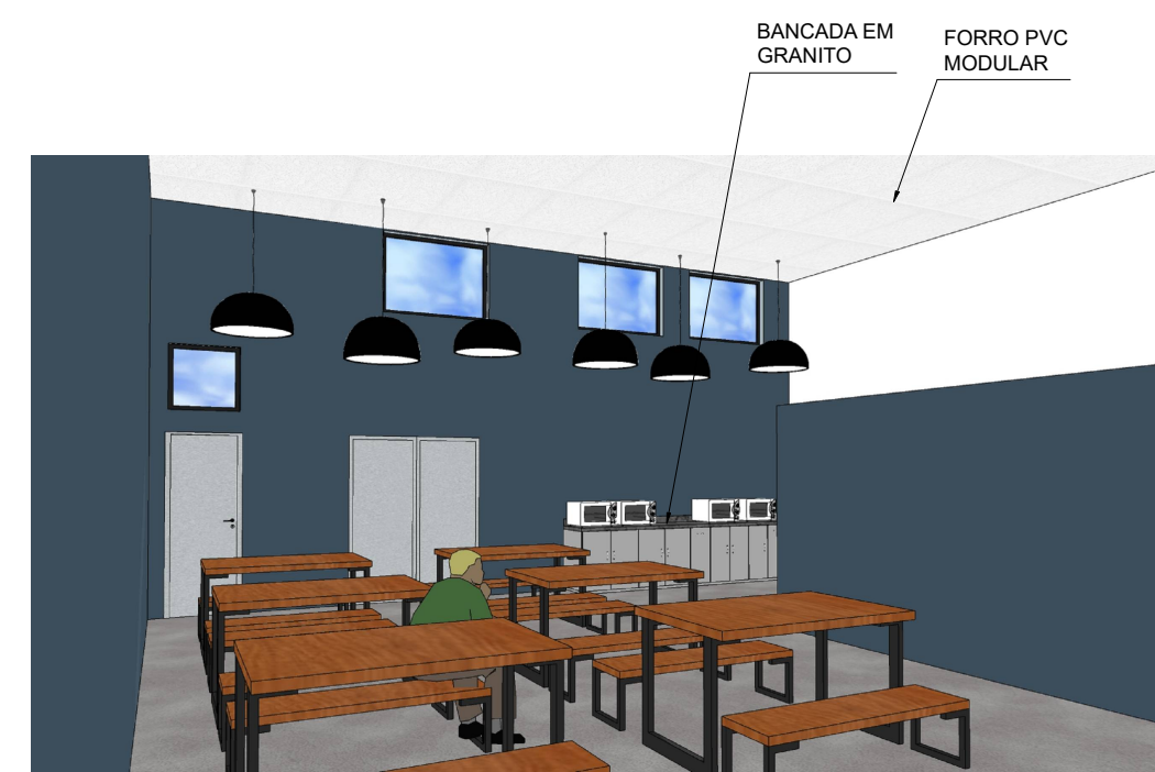
PERSPECTIVA - REFEITÓRIO