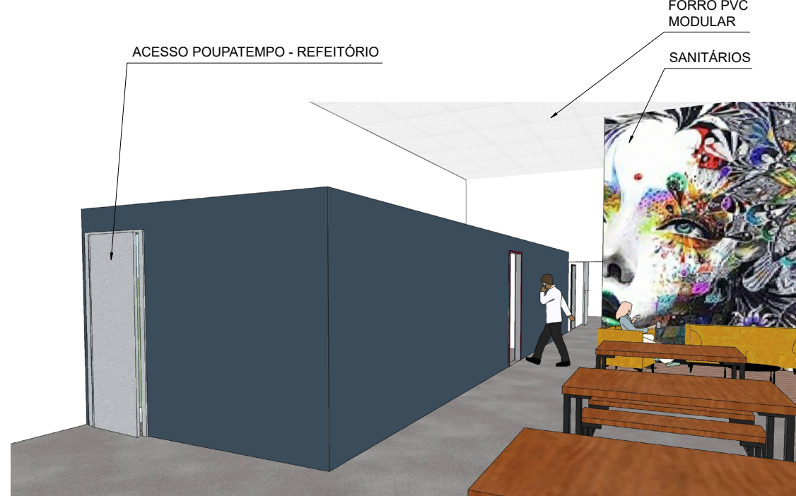
PERSPECTIVA - REFEITÓRIO